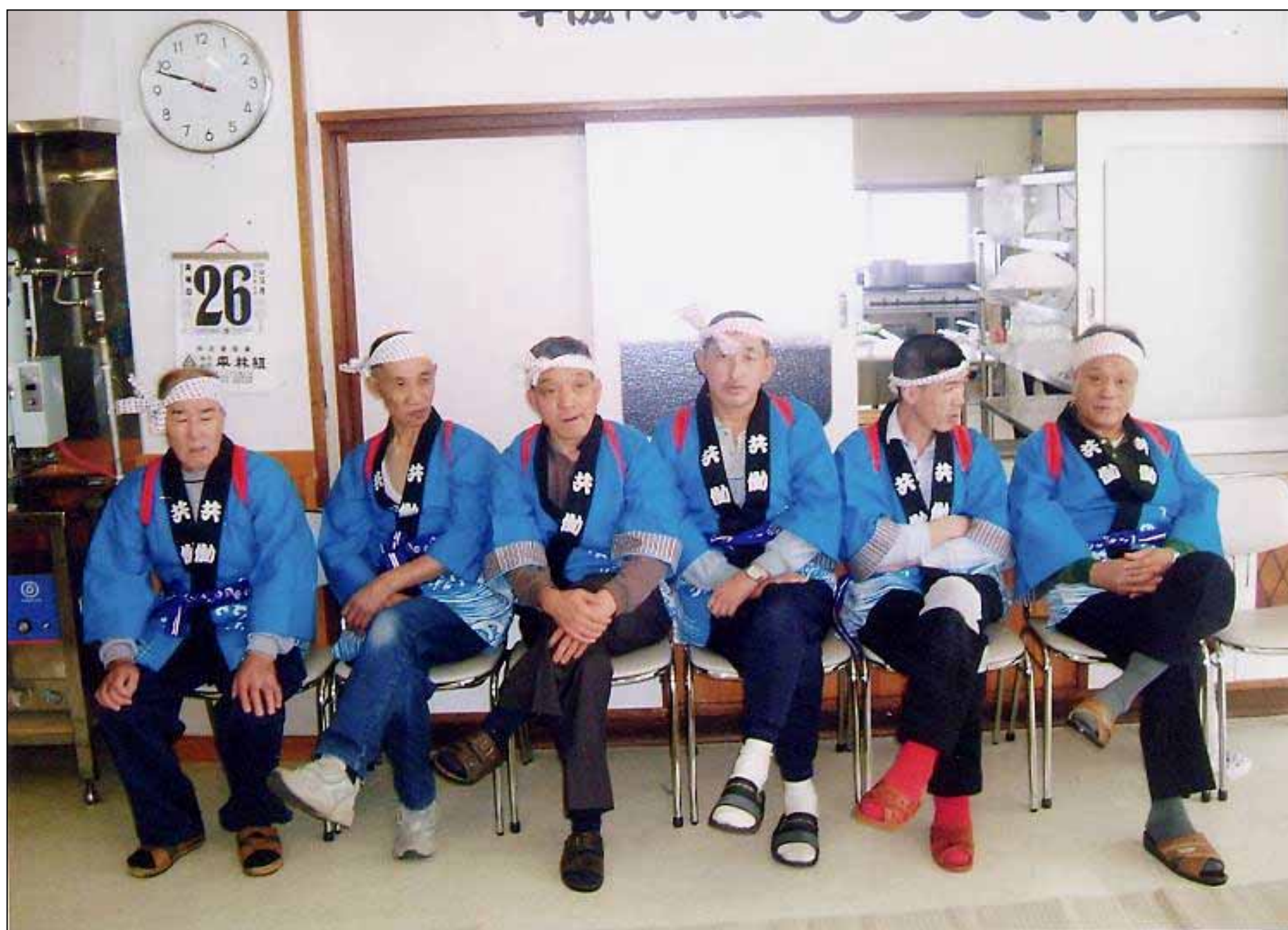
撮影場所／函館共働宿泊所救護部 餅つき大会会場にて 撮影日時／平成15年12月26日