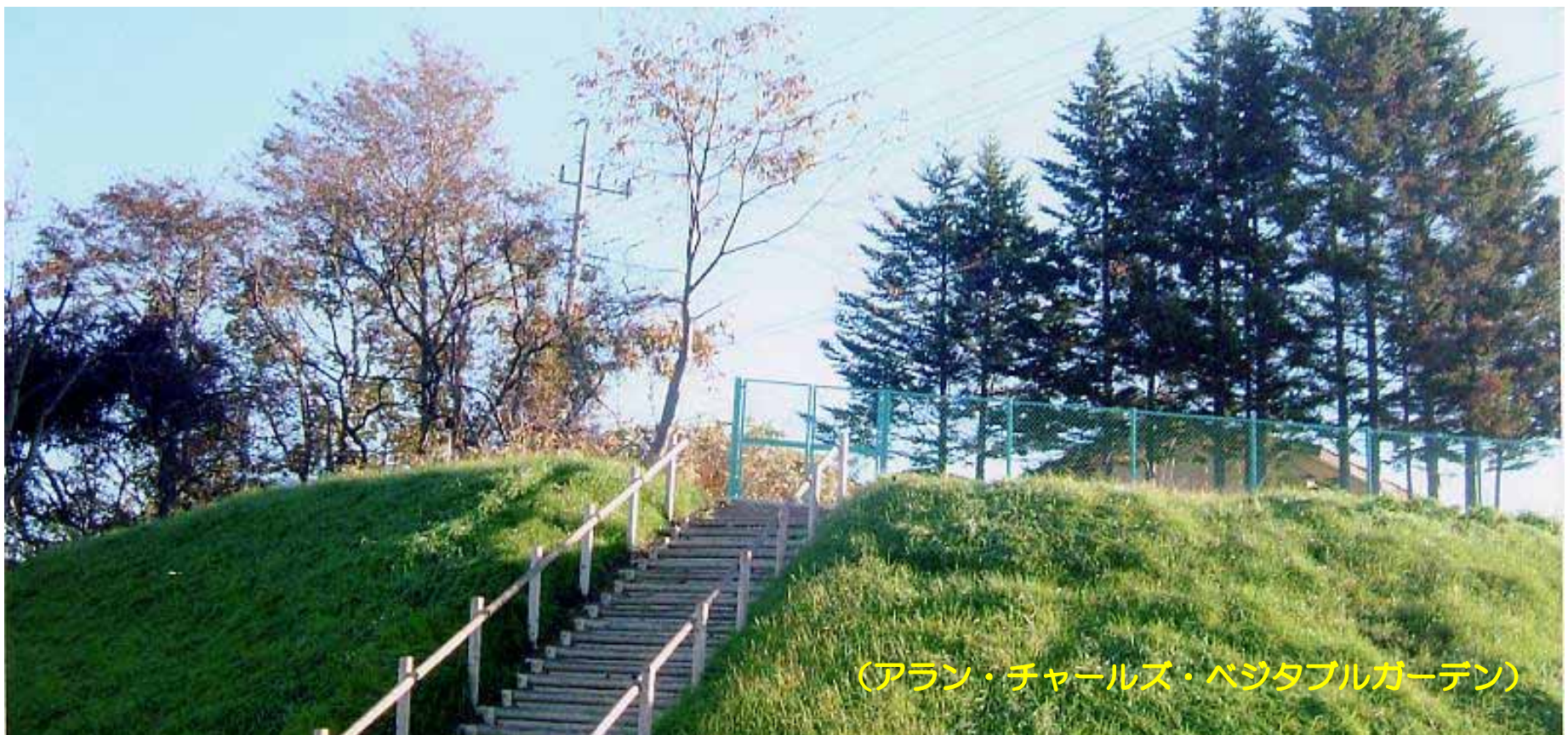
(アラン・チャールズ・ベジタブルガーデン)