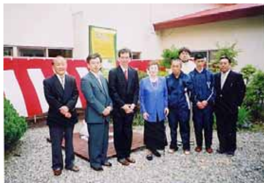
記念プレート除幕式(15. 8. 31)